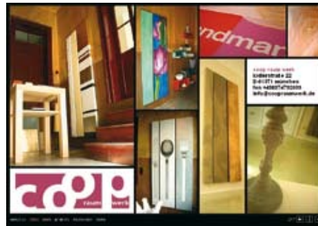
Webrealisation für coop raum werk, München

Kreativität schöpft er aus seinem starken Interesse an Kunst. Die Ideenvielfalt wird aber auch ständig durch seine Kinder ergänzt.