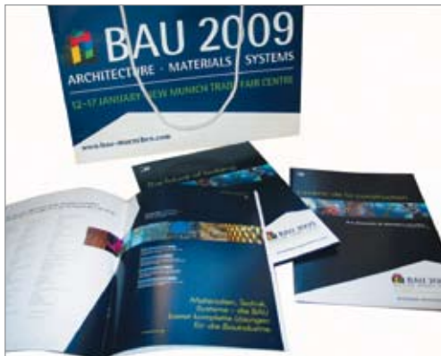
Bau 2009: Imagebroschüre, Pressemappe und Umhängetasche (für wob ag)

Fachliche Kompetenz erwarb sie sich mit dem Abschluss auf der Medienakademie München, gefolgt von einem Studium in Erwachsenenpädagogik. Bevor Sabine Fincks 2001 ihre eigene Agentur gründete, holte sie sich den wichtigsten Grundstock, nämlich jede Menge Erfahrung an vielseitigen, internationalen Projekten in renommierten Full-Service Agenturen. Umfassende werbliche Möglichkeiten von der klassischen Produktwerbung bis hin zu langfristig angelegten Imagekampagnen werden deshalb von ihr versiert umgesetzt.