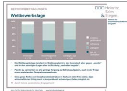
Präsentation für Heinritz, Salm & Stegen