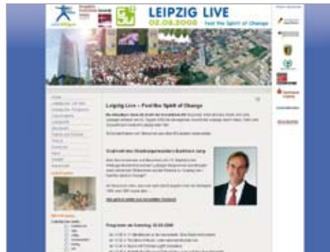
Webrealisation für Open-Air-Event „Leipzig Live“