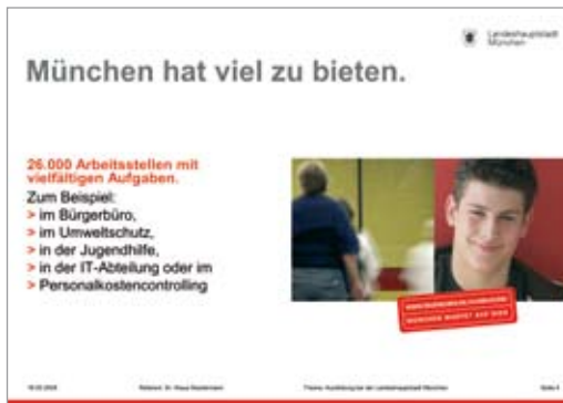
Präsentation für WP&G