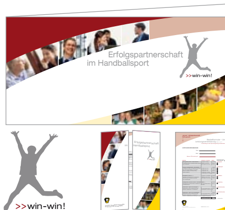
TSV Ismaning: Sponsorenpaket (Logo, Mailingkarte, Sponsorenmappe), Spielplakat, Webauftritt u.v.m.